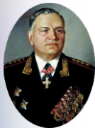
Генерал армии А.В. Хрулёв

Военная орденов Кутузова и Ленина академия материально-технического обеспечения имени генерала армии А.В. Хрулёва Министерства обороны Российской Федерации прошла большой и славный путь своего становления и развития. Она ведет свою историю с 31 марта 1900 года, когда в столице России – Петербурге впервые в мире было создано специальное военно-учебное заведение тыла – Интендантский Курс для подготовки офицеров и чиновников интендантского ведомства.